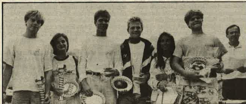
Die Sieger der internationalen Jugendmeisterschaften, die am vergangenen Wochenende vom Segelclub Traunkirchen veranstaltet wurden.

seit mehreren Jahren endlich wieder einmal stark vertreten: 20 Boote kämpften in dieser Klasse um den Staatsmeister-Titel.